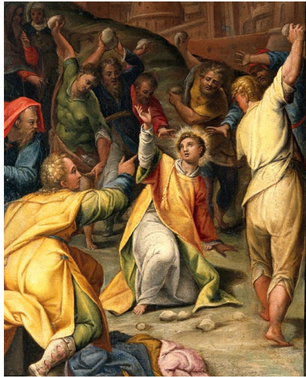
Ukamenowanie św. Szczepana

Z pomocą w przyjęciu tych słów przychodzi nam święty Mateusz poprzez słowa Ewangelii, które przytaczają to wszystko, co mówił Jezus: „Mieście się na baczności przed ludźmi! Będą was wydawać sądom i w swych synagogach będą was biczować. Nawet przed namiestników i królów będą was wodzić z mego powodu, na świadectwo im i poganom” (Mt 10, 17–18). Słowa z ust Jezusa nie padają w tym dniu po to, by nas straszyć. Nie! Ale po to, by przygotować nas do pracy nad sobą i nad swoim własnym życiem. Dzięki Bogu nic nam nie zagraża, życia nikt nam nie odbiera, dlatego